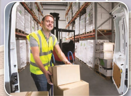
Lieferungen ausserhalb Öffnungszeiten